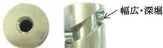
SCM435(H) スライドカム Φ35x36