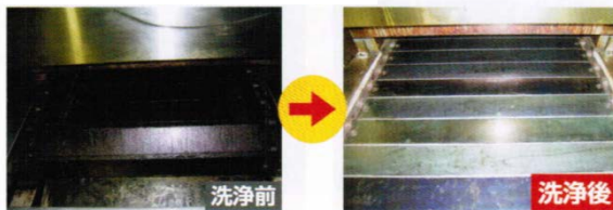
機械装置に付着した錆び・油