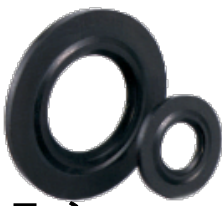
シールワッシャー