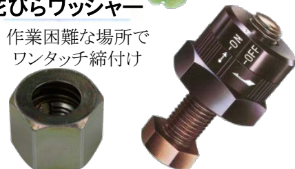
サンクイックナット オールクイックナッター