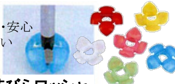
花びらワッシャー