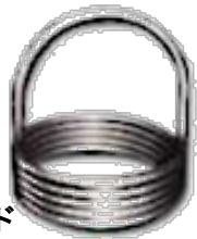
ハイパーロード スプリング