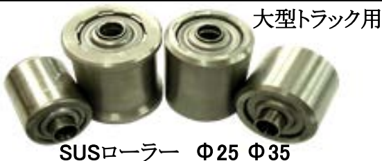
SUSローラー Φ25 Φ35