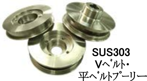
SUS303 Vベルト・ 平ベルトプーリー