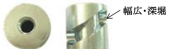
SCM435(H) スライドカム Φ35x36