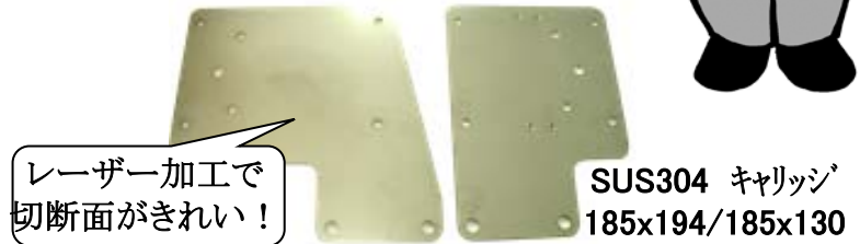
SUS304 キャリッジ 185x194/185x130