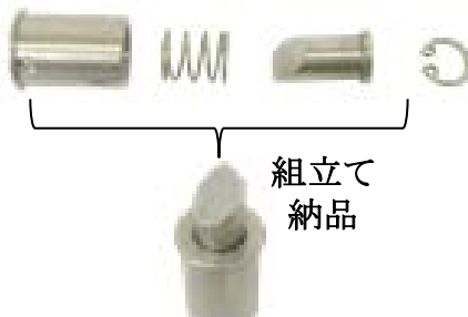
SUS製ストッパー部品

あらゆる部品の加工・追加工からさらには、組立までお任せください！ネットワークを駆使して解決します！