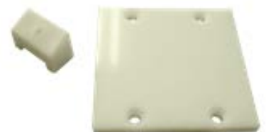
左:POMスライドコア 右:PPカムカバー