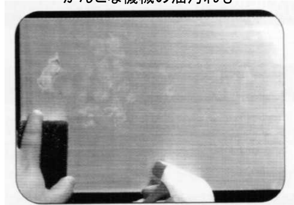
ステンレスの手垢落とし （目安：10倍希釈）