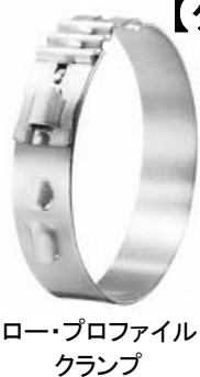
ロー・プロファイル・クランプ