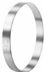
マルチ・クランプ・リング