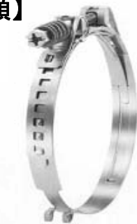
ねじ式公差追従型クランプ