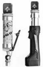
空圧式ピンサー+電動コードレス・ピンサー