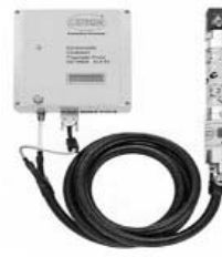
電気制御式空圧ピンサー