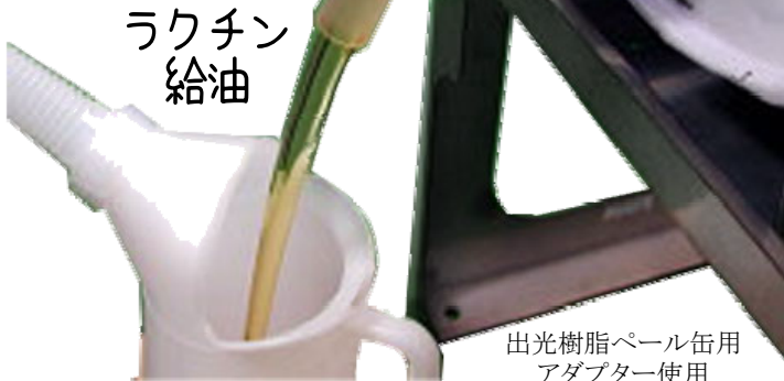
出光樹脂パール缶用 アダプター使用

PP樹脂製【Pタイプ】:水性・一般油用 下向固定(ノズル):ニトリルゴム(パッキン) 口径:40Φ:2,600円(4色)