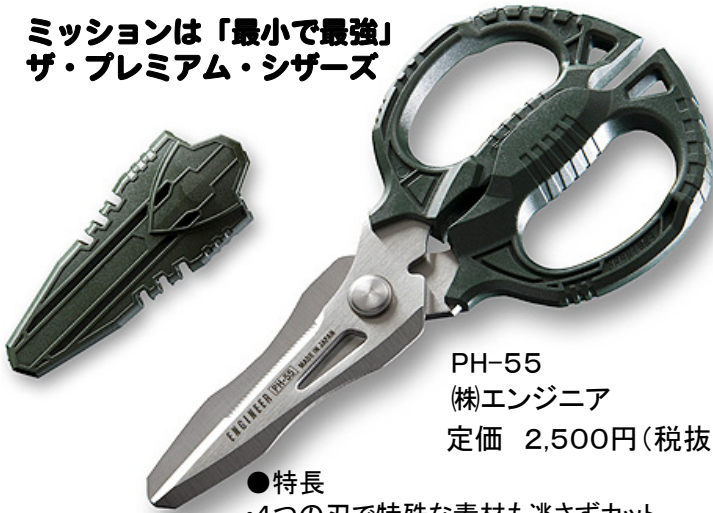
PH-55 (株)エンジニア 定価 2,500円(税抜)